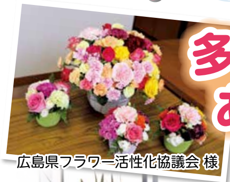
広島県フラワー活性化協議会 様