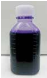
ピオクタニン含嗽液 (キシロカイン・ピオクタニン・重曹) 麻酔薬の入ったうがい薬。 口内炎のひどい患者さんに処方します。