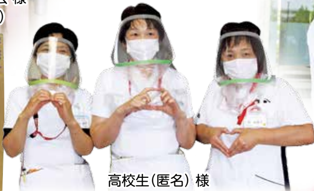
高校生(匿名) 様 (フェイスシールド)