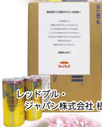
レッドブル・ ジャパン株式会社 様