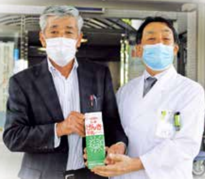
広島県酪農業協同組合 様