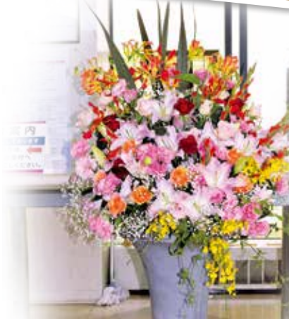
日本花き振興協議会 様 (木村生花店 様)