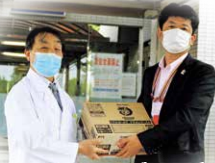
コカ・コーラボトラーズ ジャパン株式会社 様