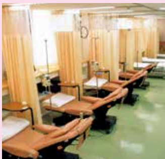
化学療法センター

副作用がつかない場合や心配なことがありましたら、我々せず主治医や私たちスタッフにご相談ください。