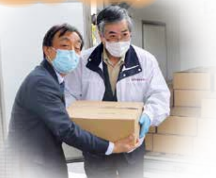
あせひら乳業株式会社 様