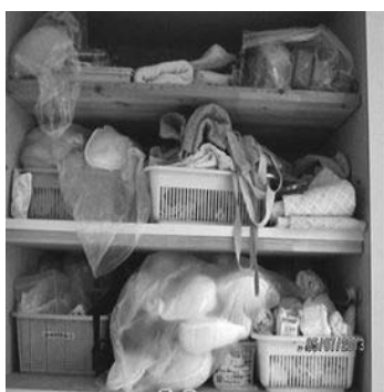
5 S 導入前